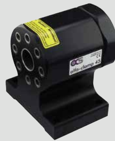
200045 alfa-clamp 45