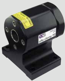
200090 alfa-clamp 90